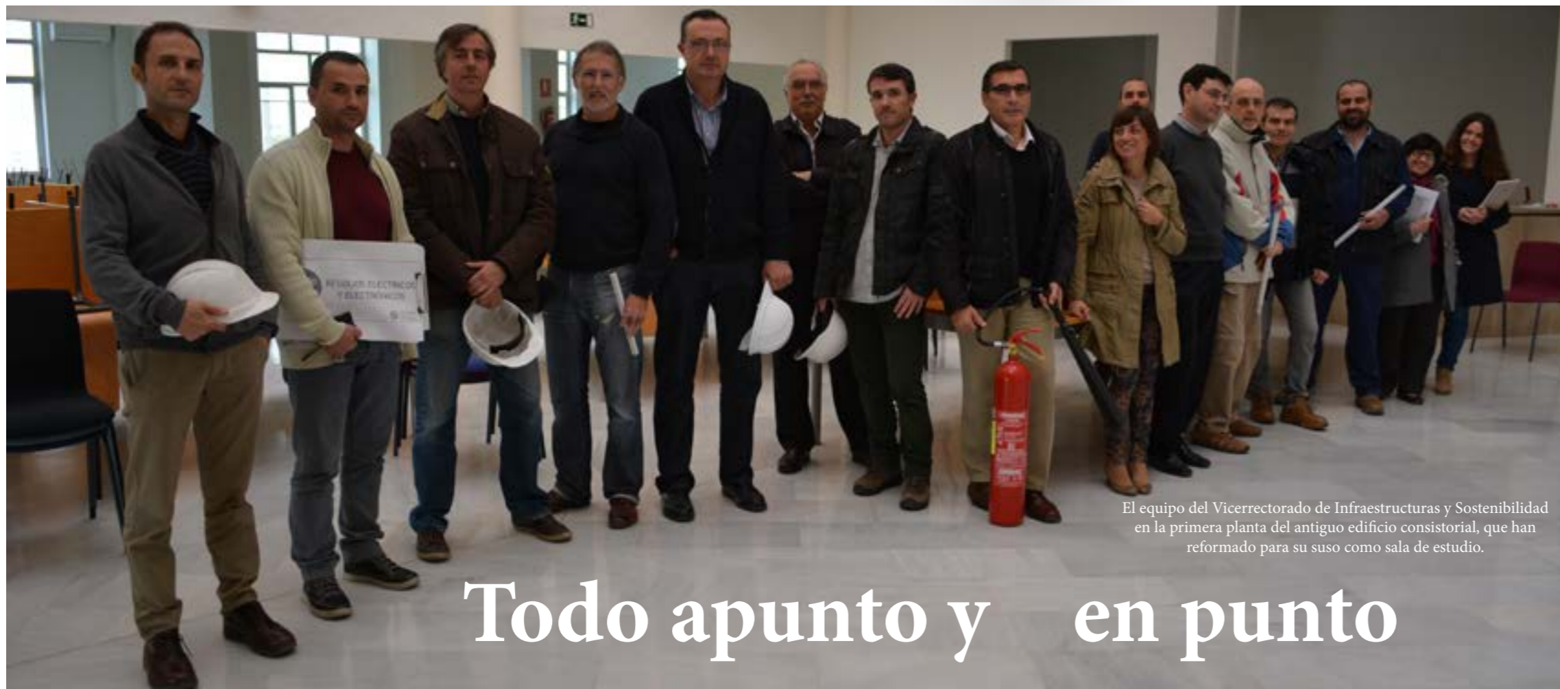
El equipo del Vicerrectorado de Infraestructuras y Sostenibilidad en la primera planta del antiguo edificio consistorial, que han reformado para su uso como sala de estudio.