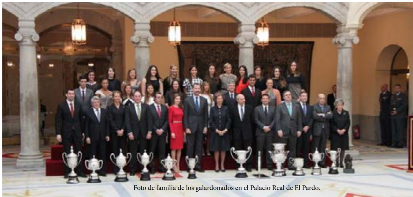
Foto de familia de los galardonados en el Palacio Real de El Pardo.