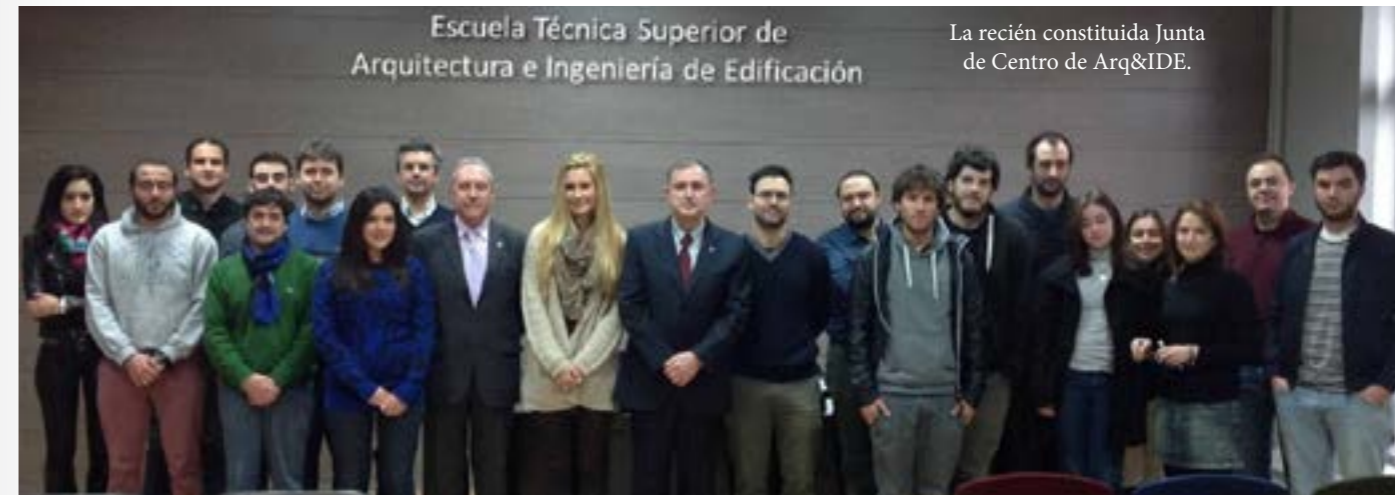
La recién constituida Junta de Centro de Arq&IDE.

Este trabajo es fruto de la actividad investigadora de los miembros de la Cátedra Cajamar de la UPCT en el ámbito del cooperativismo agroalimentario, quienes, junto a otros 22 expertos han participado en el reciente monográfico de la colección de estudios "Mediterráneo Económico" bajo el título de "El papel del cooperativismo agroalimentario en la economía mundial".