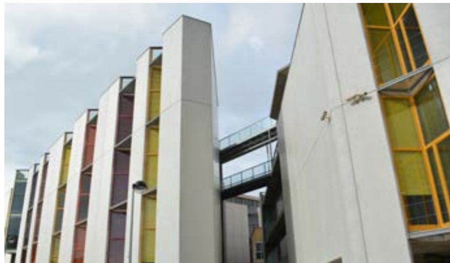
Imagen exterior del ELDI, en el que se ubicará el Centro de Contenidos Digitales.

que ya hace la Politécnica de Cartagena se encuentran las videonoticias del Servicio de Comunicación, la grabación y el alojamiento online de conferencias y actividades académicas y los 'polivideos', con los que los profesores explican en formato audiovisual los contenidos de sus asignaturas a los alumnos.