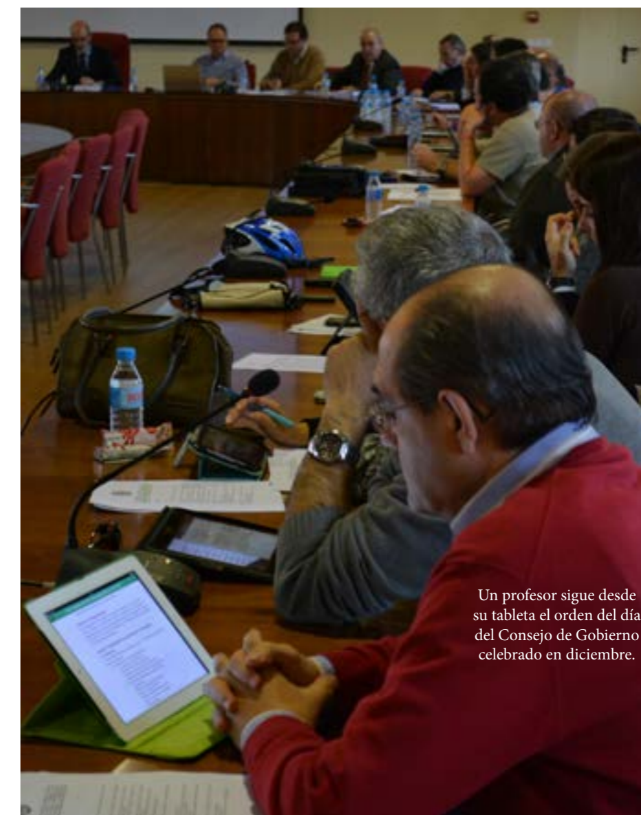
Un profesor sigue desde su tableta el orden del día del Consejo de Gobierno celebrado en diciembre.

Dichas medidas de reducción de gasto y de mejora de los ingresos deberán estar preparadas para el verano de 2014.