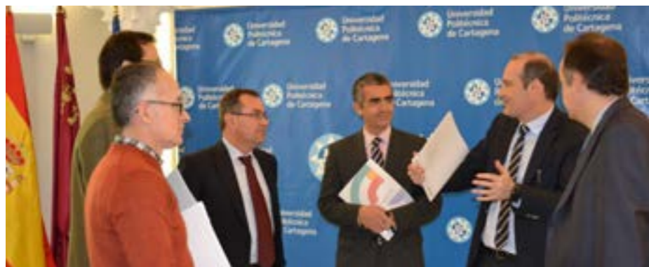
Reunión en la UPCT de los responsables de la Cátedra, la Politécnica y Cajamar.

na, presidió el acto de entrega de estos galardones, que concede el Consejo Superior de Deportes para reconocer a personas o entidades que, bien por su directa actividad o iniciativa personal, bien como partícipes en el desarrollo de la política deportiva, han contribuido en forma destacada a impulsar o difundir la actividad físico-deportiva.