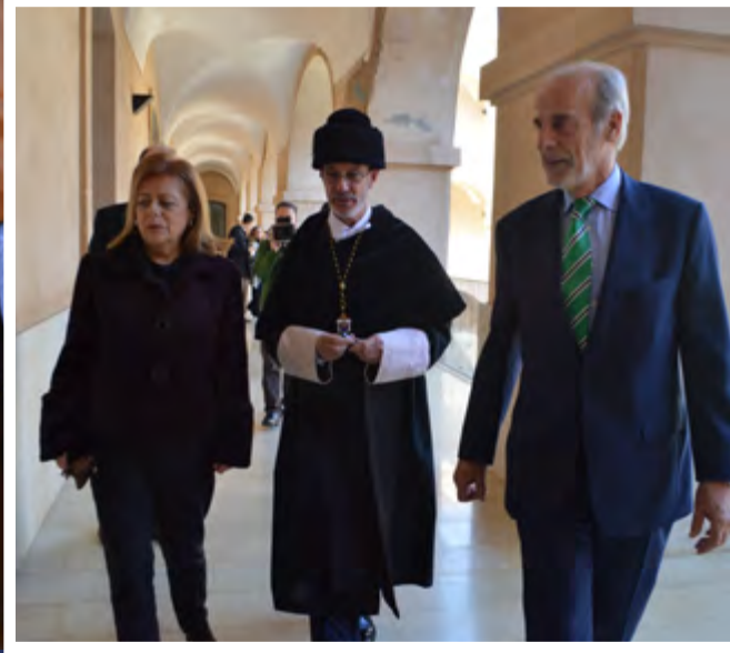
► El cortejo, a su salida del Paraninfo