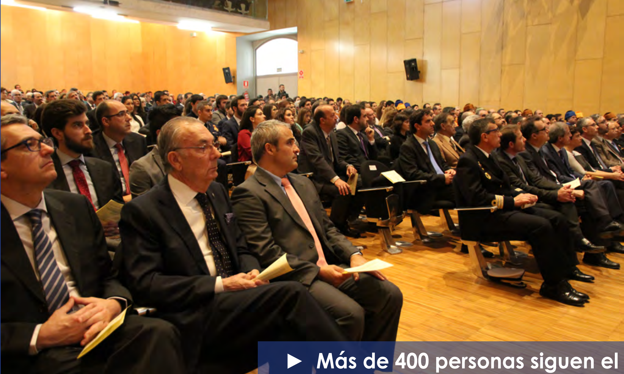
► Más de 400 personas siguen el acto con atención