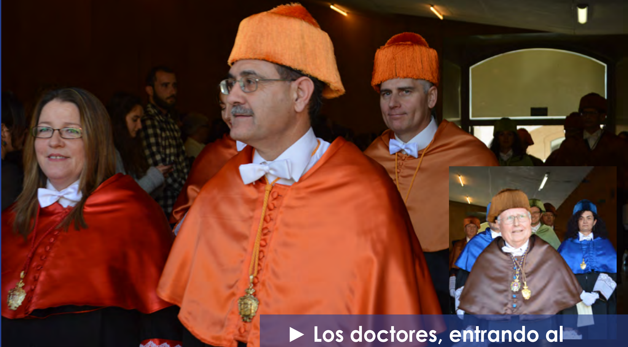
► Los doctores, entrando al Paraninfo