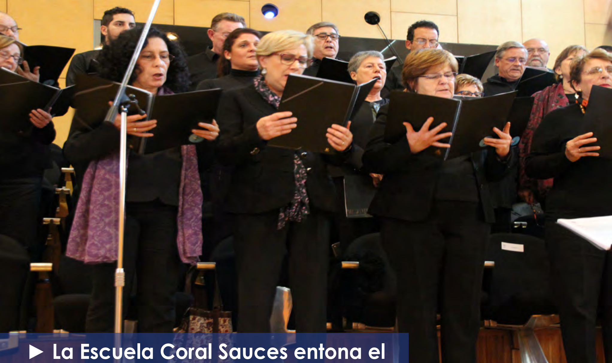
► La Escuela Coral Sauces entona el Canticorum Iubilo