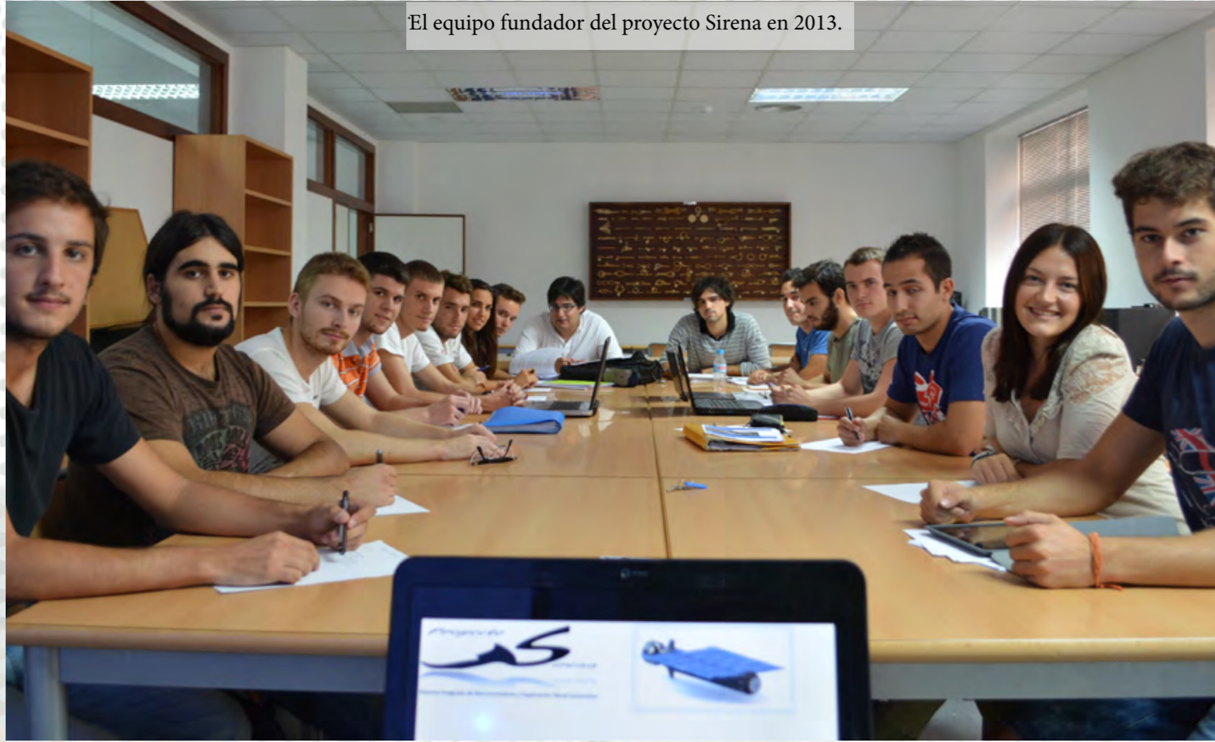
El equipo fundador del proyecto Sirena en 2013.